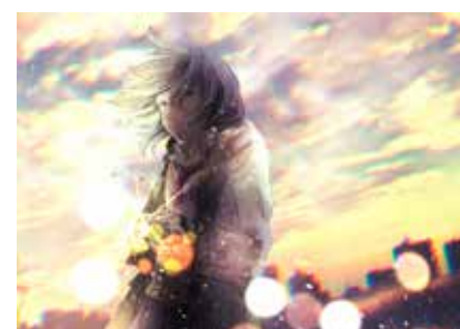
クリエイティブ賞