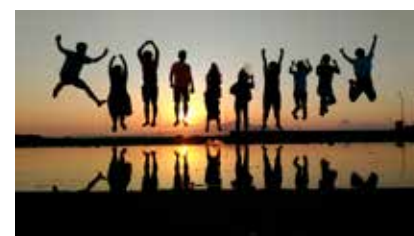
写真部門 山陽百貨店賞