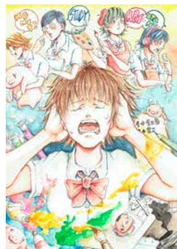
ひのもとなにしてる大賞