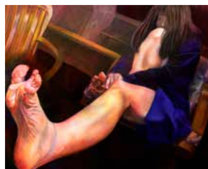
イラスト部門 優秀賞