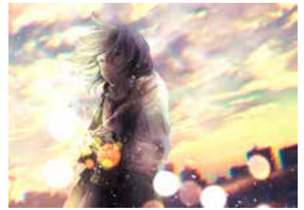
クリエイティブ賞