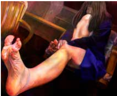
イラスト部門 優秀賞