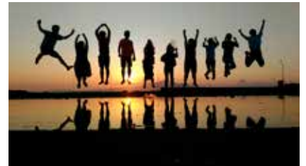
写真部門 山陽百貨店賞