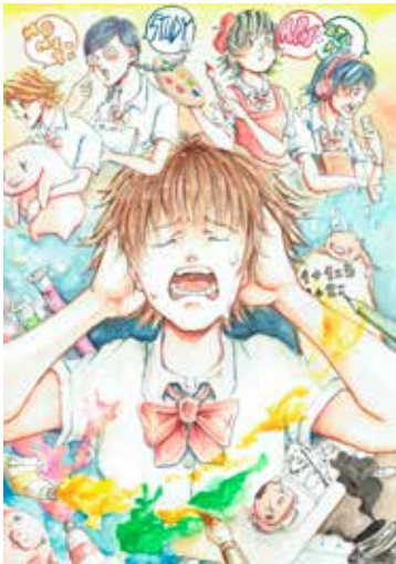
ひのもとなにしてる大賞